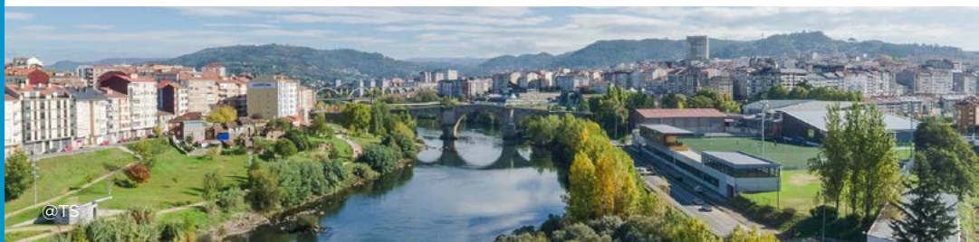
Río Miño - Ourense

O paso dos séculos deixou unha grande riqueza monumental en forma de vilas medievais, mosteiros, igrexas, conventos e pontes e, aínda que non existen grandes alturas, a zona conta con varios miradoiros que se abren ás paisaxes de viñedos e hortas tan características desta rexión.