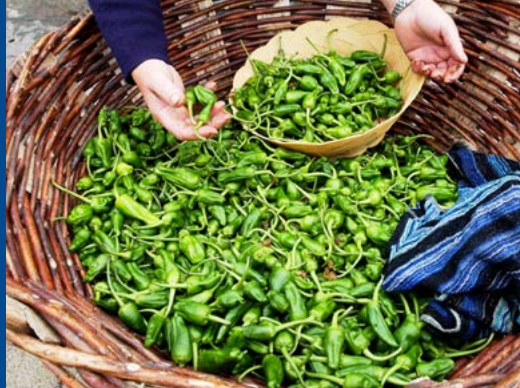
Pimientos de Padrón

erguido sobre a rocha granítica da ladeira do monte de San Gregorio. A igrexa, única zona accesible á vista, é distinguida e fermosa. Dende o atrio, unha visión planimétrica de Padrón e o seu contorno.