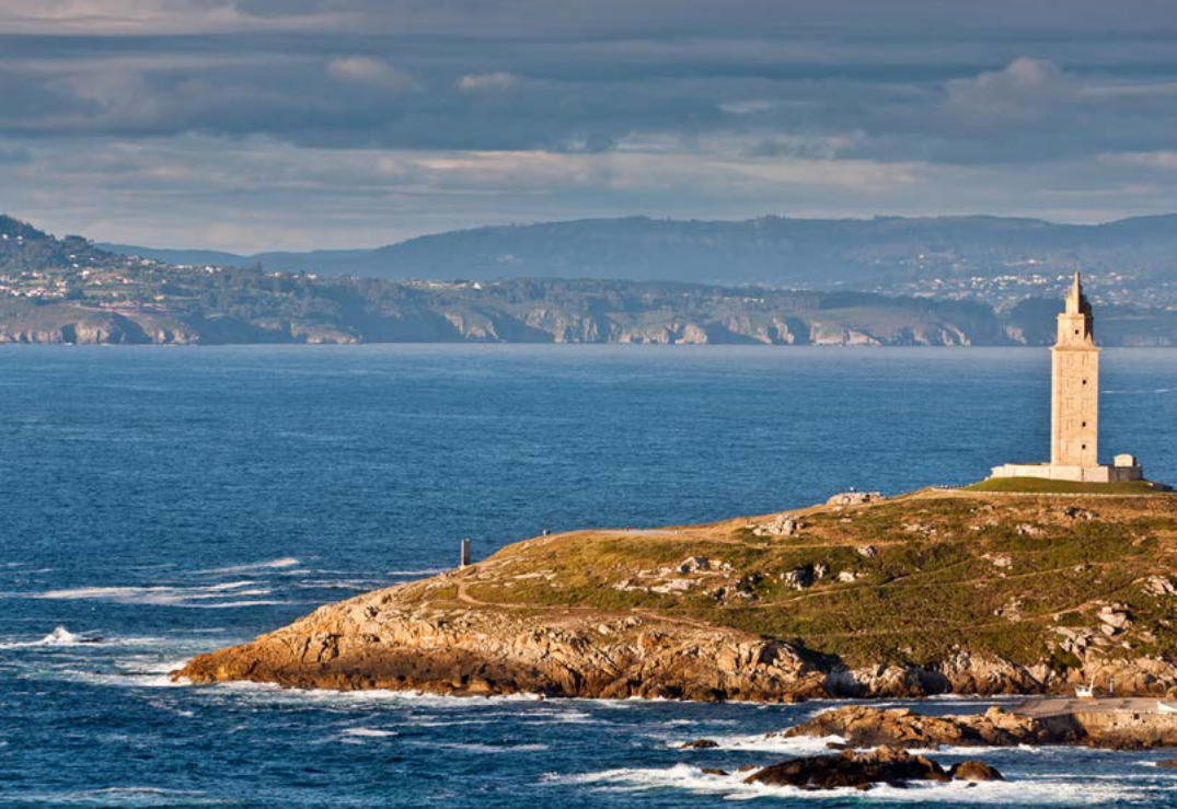
Torre de Hércules