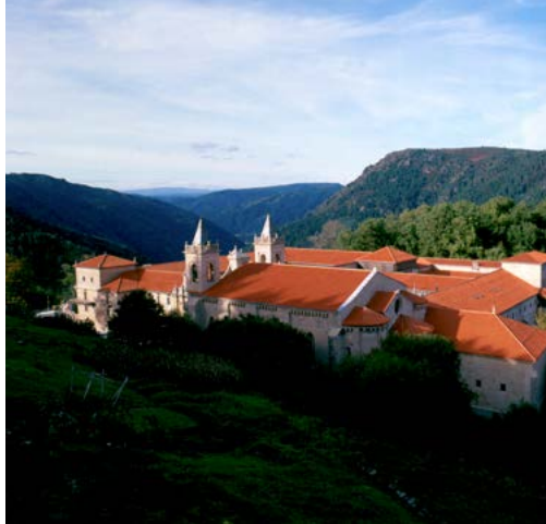
Santo Estevo de Ribas de Sil

Na mesma ribeira do río Sil está o soberbio Mosteiro de Santo Estevo de Ribas de Sil, cenobio beneditino orixinario do século VI, rehabilitado para uso hoteleiro pola marca Paradores. Conserva un notable claustro románico, aínda que con alteracións do século XVI. Ademais do románico, a súa estrutura e decoración contan con elementos góticos, renacentistas e barrocos. No 1923 recibiu o recoñecemento de Monumento Histórico-Artístico.