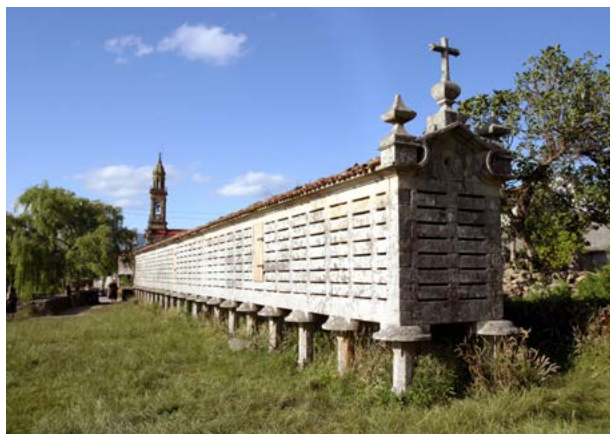
Hórreo de Carnota

O espazo ecolóxico de Carnota, que chega ata a punta de Caldebarcos, xunto ao máxico monte Pindo, fascinante polo seu