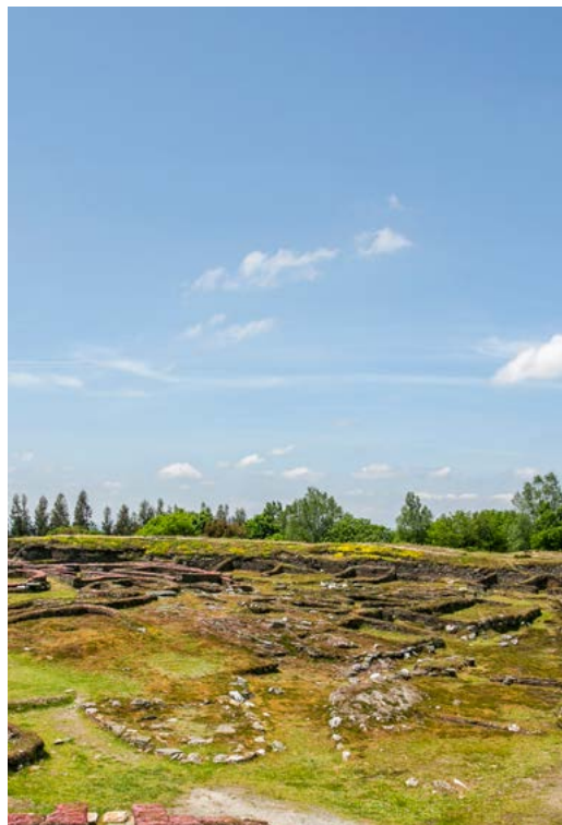
Castro de Viladonga