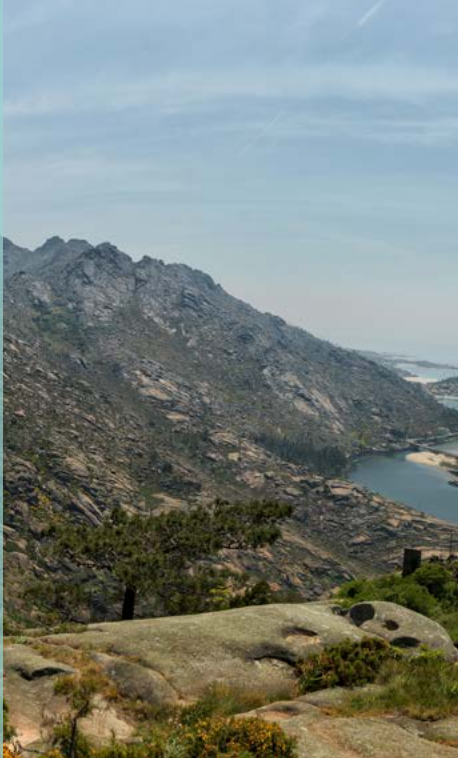
Monte Pindo

No fermoso cadro arquitectónico conservado nas vellas rúas de nomes suxestivos, destacan as construcións relixiosas sobre as civís, o que lembra a pertenza de Muros á Mitra Compostelá. Entre elas, a Igrexa de San Pedro (s.X), a antiga Colexiata de Santa María e actual Igrexa parroquial de San Pedro de Muros (s.XII), na que predomina o estilo oxival sobre os restos románicos e conserva sepulcros dos s. XV e XVI.