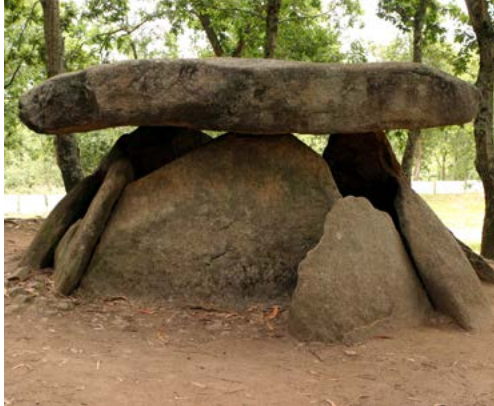
Dolmen de Axeitos

O dolmen de Axeitos, chamado popularmente 'Pedra do Mouro' leva con nós 4.000 anos. Tivo, como todos os monumentos megalíticos deste tipo, uso funerario. O dolmen estaba oculto baixo un túmulo de terra e tiña un corredor de entrada, hoxe desaparecido, orientado cara o sol nascente.