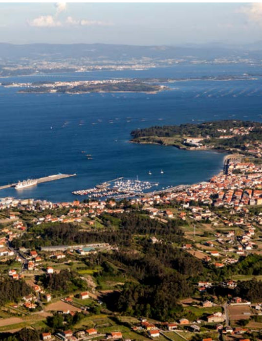
A Pobra do Caramiñal desde A Curotiña (@ATG)

A xigante duna móbil da praia de Corrubedo, formada por un conxunto de dunas continuamente remodeladas polo vento, é única no litoral de España polo seu tamaño - alcanza 2,5 km de longo e pode chegar aos 15 m de alto-, e porque a acompañan dúas lagoas: una de auga doce (Vixán) e outra de auga salgada (Carregal), que compoñen unha zona de marismas de alto interese natural.