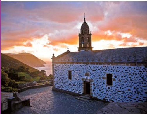
San Andrés de Teixido