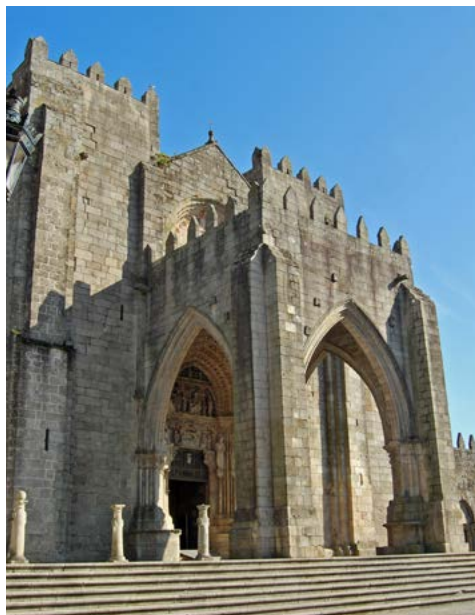
Catedral de Tui

A Fortaleza de Valença do Minho é o correlato da de Tui ao outro lado do río, xa en terras portuguesas. Sen embargo, é menos recia e recolecta, máis luminosa, e o seu carácter portugués nótase tamén no seu empedrado, distinto do galego, e na brancura dos seus edificios, moitos deles decorados cun elemento característico da arquitectura portuguesa: o azulexo. Valença está salpicada de pequenas igrexas e nichos de estilo barroco.