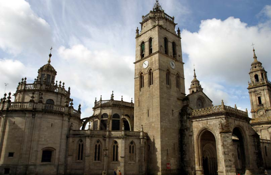
Catedral de Lugo