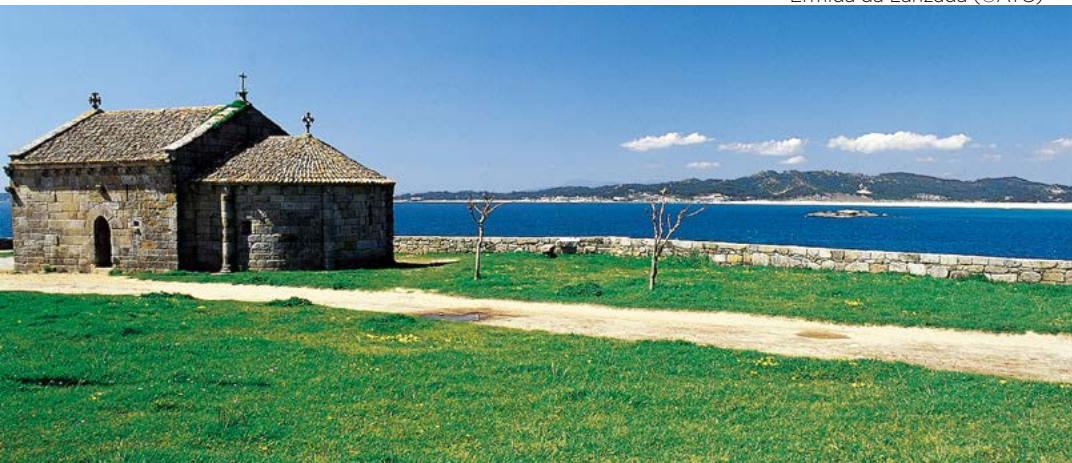
Ermida da Lanzada

Malia que hai pouco máis de medio século Sanxenxo e Portonovo eran só dúas pequenas aldeas de pescadores, hoxe en día son as capitais do veraneo de Galicia. As súas praias e a súa movida nocturna son un forte imán para galegos, resto de españois e para os veciños portugueses.