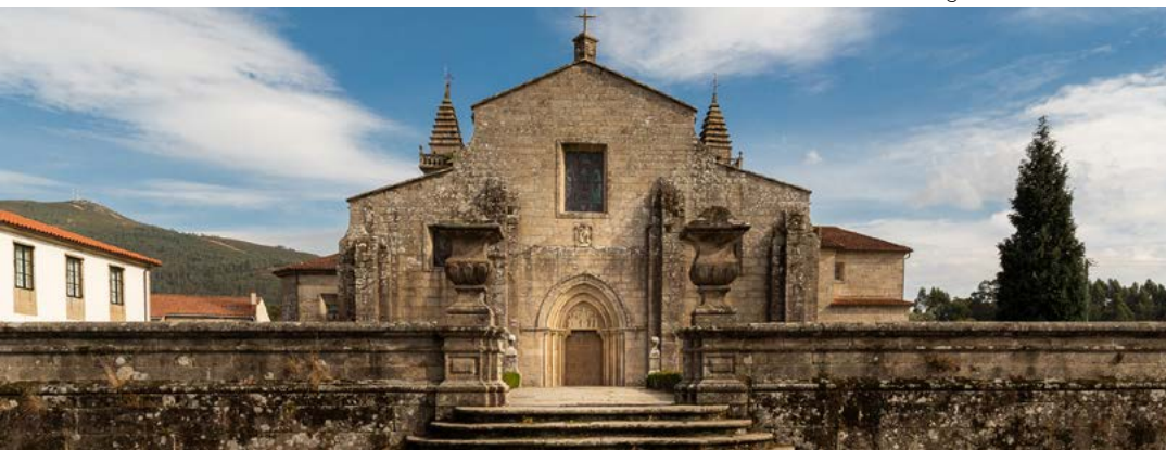
Igrexa de Iria Flavia

O Santuario de A Escravitude, que sinala o límite das terras de Padrón, asómase á estrada case coma se dunha torre vixía se tratase. Conta a lenda que un home que ía camiño de Compostela sandou subitamente da súa enfermidade despois de beber auga desta fonte. Agradecido, loaba á Virxe por liberalo da escravitude do seu mal, o que explica a orixe do nome do lugar. Pola esquerda do templo, sae un camiño que chega cara a pequena e solitaria igrexa parroquial, de ábsida románica.