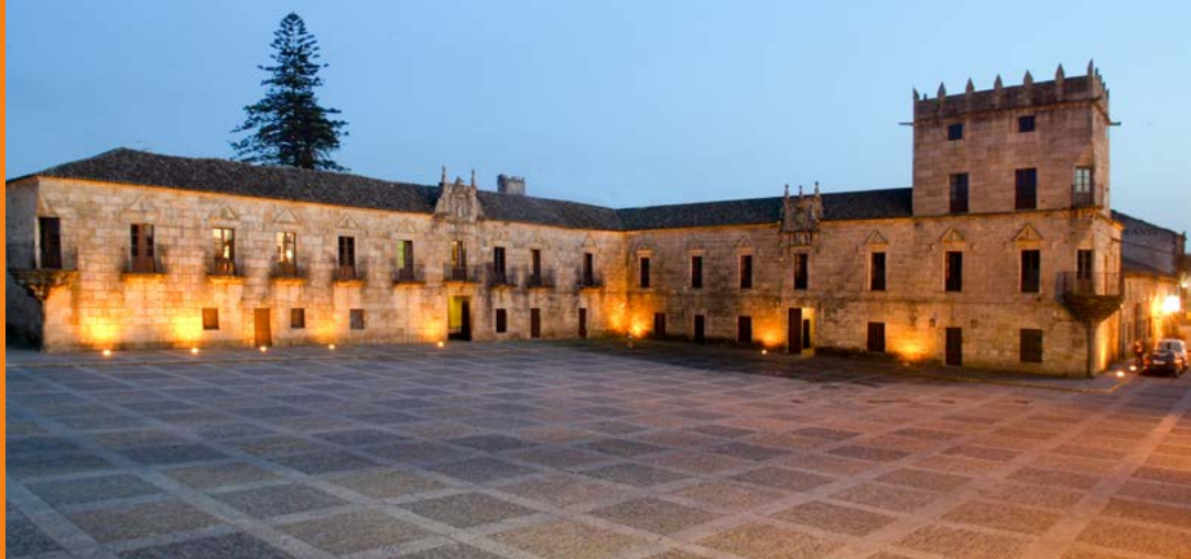
Praza e Pazo de Fefiñáns