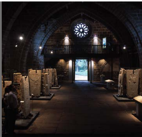
Santa María A Nova

Situada no fondo da ría de Muros e Noia, esta poboación foi importante na historia de Galicia, e conserva aínda un interesante casco antigo de orixe medieval. Na vila hai dous templos que figuran entre os máis importantes da arquitectura galega: Santa María A Nova (s. XIV), que contén interesantes lápidas gremiais, e San Martiño (s.XV). Destaca tamén o de San Francisco e, en canto a espazos urbanos, a rúa de O Curro, coa Casa da Escola de Gramática.