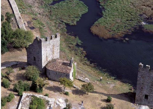
Torres de Oeste - Catoira

A amplitude da ría propiciou que desde antigo fora unha vía aberta ao comercio, pero tamén ás invasións medievais de normandos e árabes, de cuxa presenza son testemuña