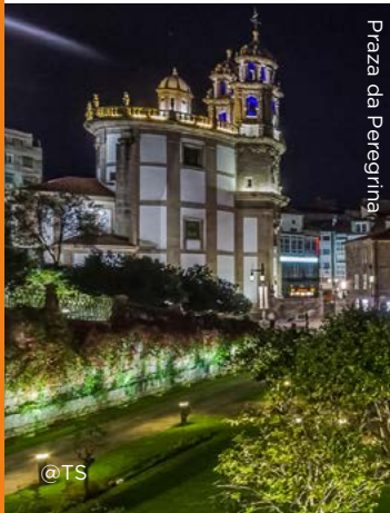
Praza da Peregrina

Todo un mundo en miniatura, moi concorrido por galegos e foráneos durante a época estival polo seu agradecido clima, as magníficas praias, os saborosos peixes e mariscos e a variedade de servizos turísticos.