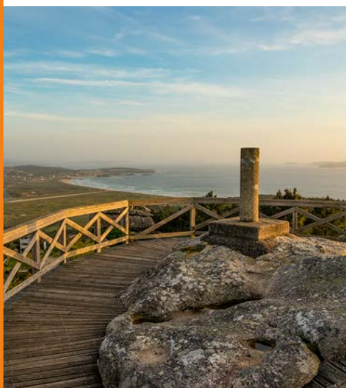
Mirador Siradella

A península do Grove, só levemente enganchada ao continente, ten en realidade personalidade de illa. Moi frecuentada no verán, é coñecida principalmente pola calidade dos seus mariscos, que a converten na capital da gastronomía mariñeira. Pero tamén por lugares coma o monte Siradella, que cos seus 167 metros sobre o nivel do mar é o punto máis elevado da rexión e tamén o seu mellor miradoiro. O seu centro urbano ten multitude de tascas, tabernas e restaurantes onde serven exquisitos mariscos e peixes.