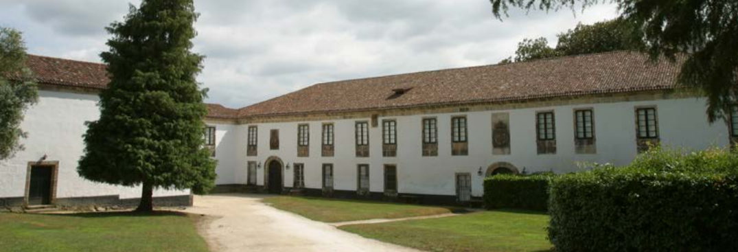
Pazo de Santa Cruz de Ribadulla

ordenarse en rúas e conserva moito do seu estilo sen que se confunda coa arquitectura estritamente burguesa nin aínda coas casas nobres derivadas de antigas casas fortes da cidade.