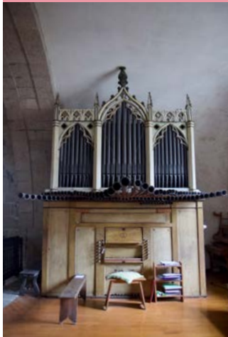
Capela das Ánimas