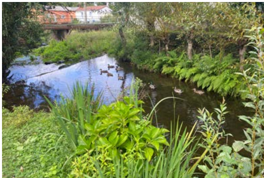
PONTE DO VISO