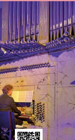
o de Anteaaltares