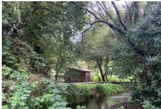
MUIÑO DE PAREDES