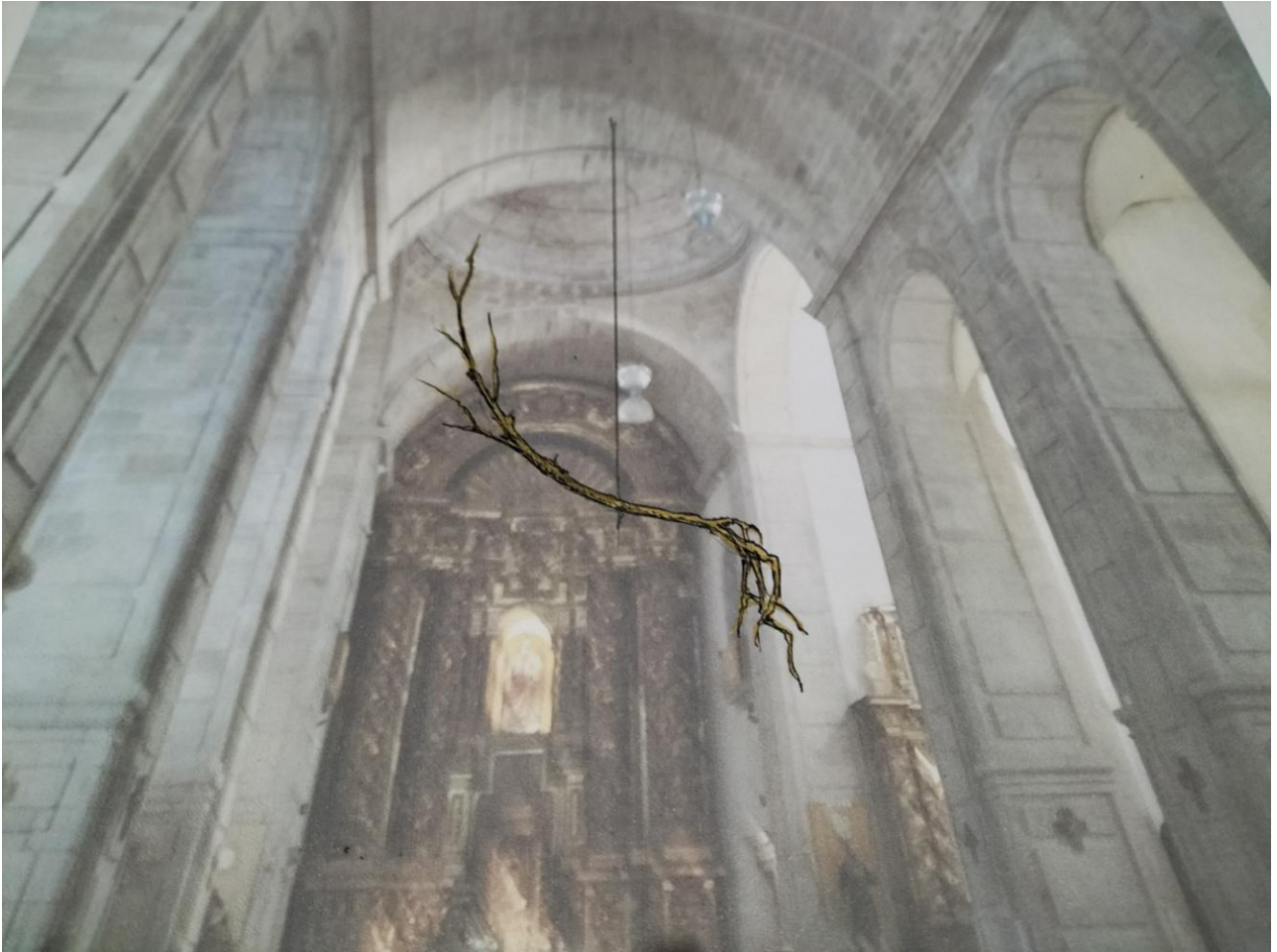
Simulaciones del diseño expositivo en claustro e iglesia