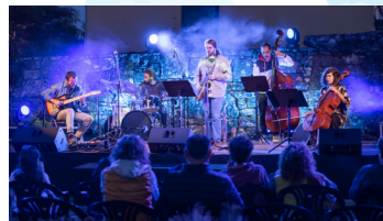
LÍMBICO (jazz, improvisación, folk)