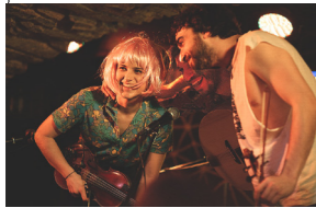
MARICARME (folk, balcánica)