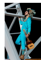
NACIÓN EKEKO - Argentina (étnica, folktrónica)