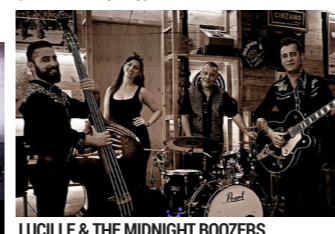
LUCILLE & THE MIDNIGHT BOOZERS (R&R, rockabilly)