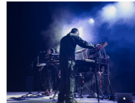
APARATO (electrónica, soul, funk)