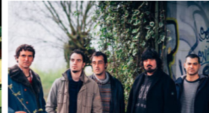
BERLAI (folk, indie, rock)