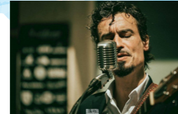
MR. COOL BOLEROS QUARTET (bolero, calipso, jazz)