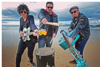
LOS WAVY GRAVIES (R&R, surf, garage)