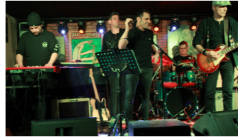
DOC MAGOO'S (rock n' roll)