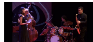
KIN GARCÍA QUINTETO (jazz, jazz-trad. galega, fusión)