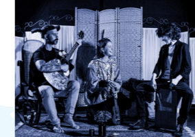
BLACK & BLUE (soul, rock, folk)