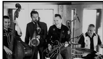
MAD MARTIN CUARTETO (rockabilly, R&R)