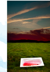
CHANZO (free jazz, rock, improvisación)