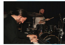
DEMO RUMUDO (jazz, rock progresivo, psicodelia)