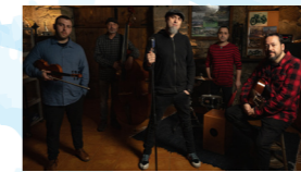
MALABESTA (folk-rock, bluegrass)