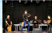
TACÓN GITANO (flamenco e bailaor)