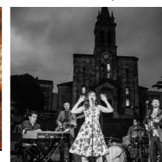
THE SHOWBASS (reggae, rock steady)