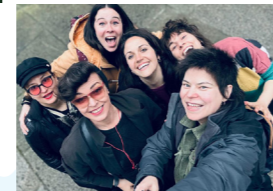
LAS ANTONIAS (bolero, pop, rumba, ska)