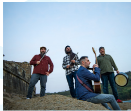
BOJ (folk celta)