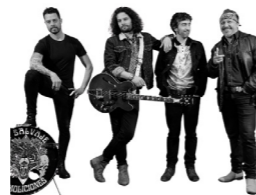
Sr. SALVAJE (rock, soul, country)