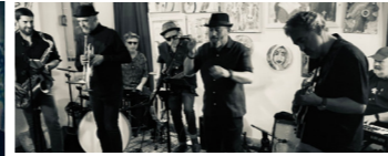
MALASOMBRAJAZZ (jazz, funk, blues)