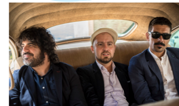
THE SWINGING FLAMINGOS (swing, jazz)