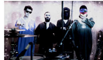
SKANDERANI (afro-punk sahel)