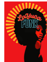
LA YUCAFUNK (funk)