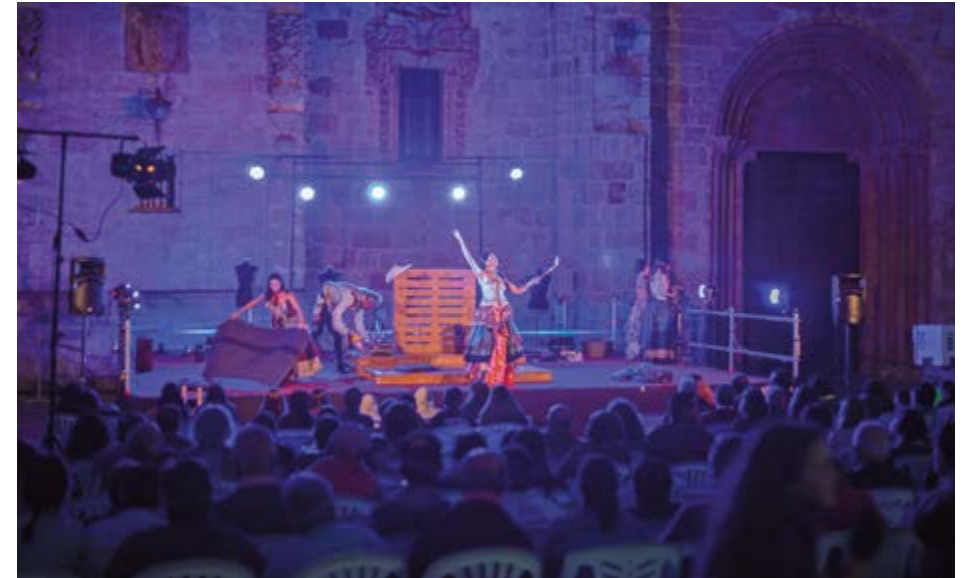
Edición 2019 - 'Bojiganga'. Teatro del Cuervo (Asturias)