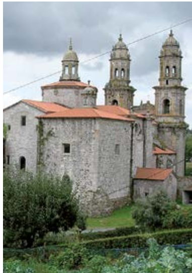
Monasterio de Sobrado dos Monxes (Galicia)

Los site specific , espacios de alto interés patrimonial e histórico donde tienen lugar los espectáculos adaptables técnica y temáticamente al entorno.