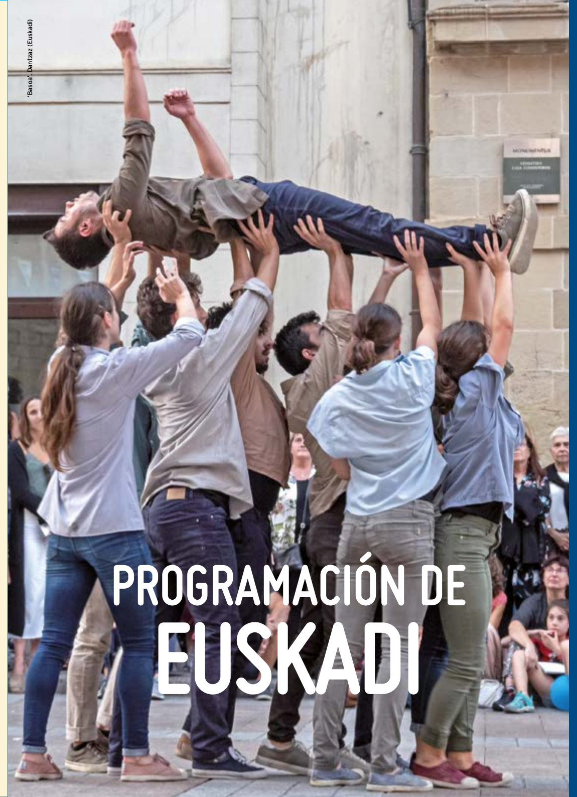
'Basos', Dantzaz (Euskadi)