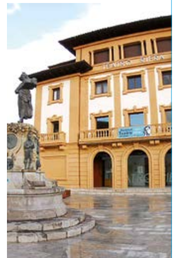
Teatro Riera (Villaviciosa, Asturias)