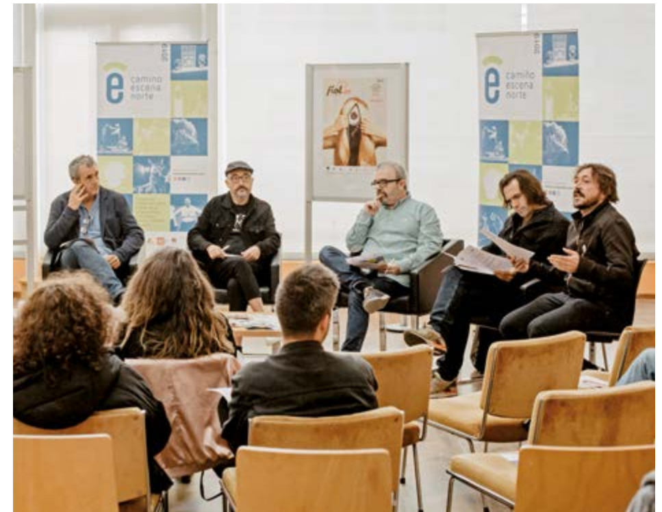
Edición 2019. Encuentro para profesionales de las artes escénicas Escena Norte Idea en Carballo (Galicia)

Así mismo, el encuentro pretende ser un foco de reflexión y conocimiento sobre la realidad del sector en las circunstancias actuales, sin perder de vista el trabajo sobre el modelo de residencias de creación que desde Camino Escena Norte quiere seguir implementándose a partir de 2021.