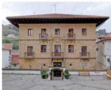
Plaza Zabiel (Mutriku, Euskadi)