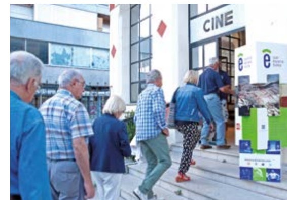
Camino Escena Norte 2019

Camino Escena Norte surge así con el objetivo de conocer más y mejor a nuestros vecinos y vecinas, dando la posibilidad al público de tener acceso a producciones escénicas de otros territorios a las que de otra manera no accedería. Aprovechando esta ruta cultural e histórica que nos une desde hace siglos, creamos un nuevo camino de cultura con espectáculos de teatro y danza, encuentros, talleres, exposiciones o jornadas profesionales, en el que mostrar la diversidad cultural, lingüística y de formatos y lenguajes escénicos de la producción escénica gallega, asturiana, cántabra y vasca.