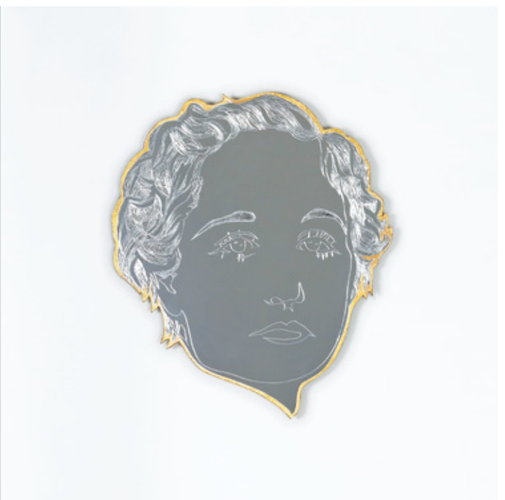
MARUJA MALLO, da serie O teu baleiro é a miña ausencia, a túa memoria é a miña presenza . Díptico. Técnica Mixta (espejo styroglass, pigmentos, pan de ouro e luz). 2017. Medidas variables. // MARUJA MALLO, da serie Tu vacío es mi ausencia, la tua memoria es mi presencia . Díptico. Técnica Mixta (espejo styroglass, pigmentos y pan de oro y luz). 2017. Medidas variables.