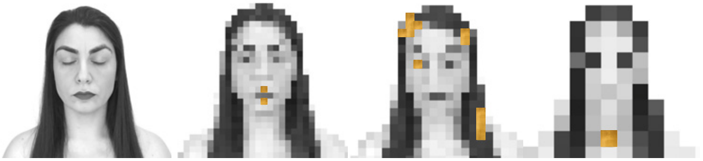
PODER VER VER PODER. Vídeo instalación. 2018. Medidas variables. // PODER VER VER PODER. Vídeo instalación. 2018. Medidas variables.

Ao percorrido principal súmase un segundo camiño paralelo e entrecruzado contestando persoalmente á pregunta “E ti de quen vés sendo?”. Con obras como “ANTES E DESPOIS” e as inéditas “EU + TI” e “TI + EU” preséntase e mostra as súas raíces: a súa primeira referencia feminina (NAI) e masculina (PAI).